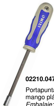
02210.0475 - 1/4x125 mm. Portapuntas magnético mango plástico Embalaje: 1 / 5 uds.