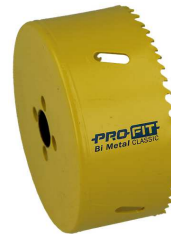
02203.0906_ Ø - 60 mm. Ø - 79 mm. Broca corona acero rápido Embalaje: 1 ud.