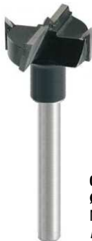
02203.0029 Ø - 35 mm. Metal duro 4 puntas Embalaje: 1 ud.