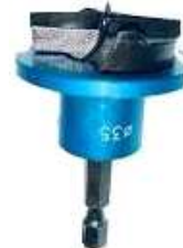
02203.0030.TP Ø - 35 mm. Metal duro Con tope de profundidad taladro de 9 a 13 mm. Embalaje: 1 ud.