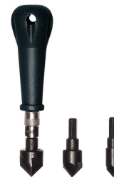
02211.6996 - Ø12-16-19 mm. Jgo. avellanador manual mango plástico Embalaje: 1 ud.