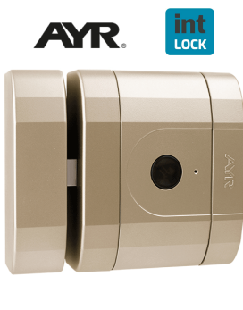
01804.5000 - Cerradura níquel mate 01804.5000.M - Mando adicional

Cerradura sobreponer llave (interior-exterior) Cilindro Ø26 mm, longitud 50 mm, llave de puntos Aguja a 33 mm. Dimensiones caja: 66x97 mm. Embalaje: 1 ud.