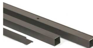
02008.0210 - altura 2,10 Mts. 02008.0250 - altura 2,50 Mts.

Jgo. perfiles antipalanca marrón de 15x15 mm. Embalaje: 1 jgo.