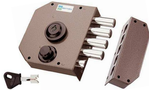
01804.0610.D - derecha 01804.0610.I - izquierda

Cerradura sobreponer golpe y llave (3 bulones) Cilindro Ø34 mm, aguja a 63 mm. 3 puntos de cierre, varillas extensibles en altura. Dimensiones caja: 132x146 mm. Embalaje: 1 ud.