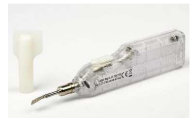
02311.0438 - Fundidor a pilas para cera dura, incluye rascador.

Todas las ceras se pueden mezclar, consiguiendo una infinidad de colores.