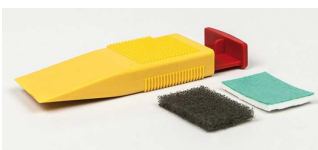
02312.0001 - Espátula multiuso

Eliminar el exceso de las ceras duras con el rascador sin dañar el área del alrededor. Los residuos se pueden eliminar utilizando las lanas abrasivas que incluye en el interior.