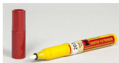
02310.K243 - Rotulador Kanten Fix Plus laca blanco RAL 9003

Para el teñido barnizado de ligeros daños superficiales sobre muebles y estructuras interiores. Rápido secado y resistente al agua.