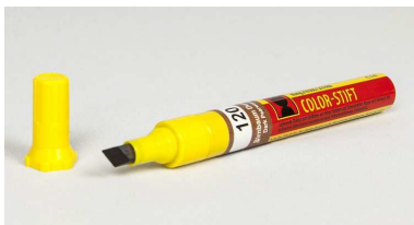
02310.Rxxx - Rotulador de retoques